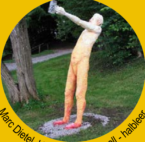
Marc Dietel, Hafenhofen, halbvoll - halbleer