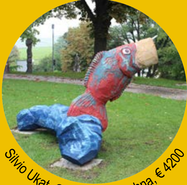
Silvio Ukat, Glauchau, Bierahna, € 4200