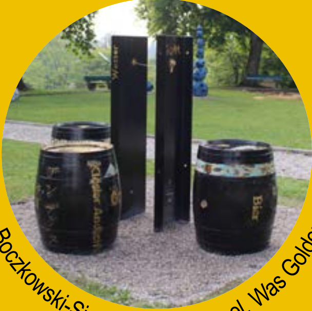
Sabine Boczkowski-Sigges, Norderstapel, Was Golden bindet