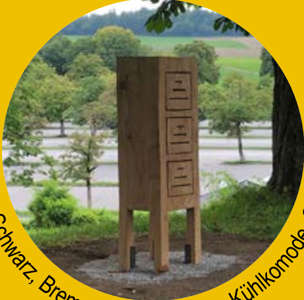
Uwe Schwarz, Bremen, emissionsfreie Kühlkomode, € 3200