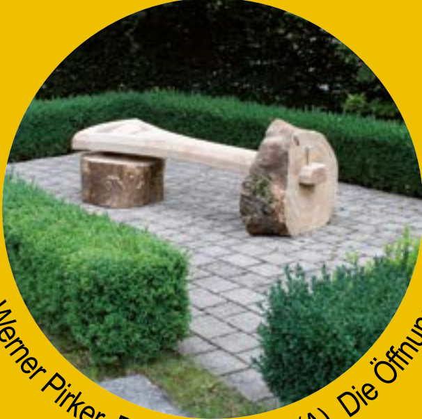
Werner Pirker, Berg im Drautal (A), Die Öffnung