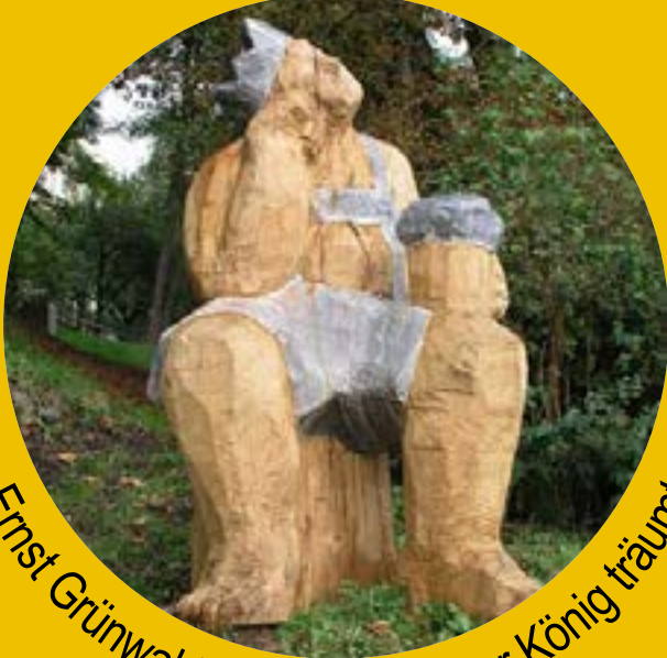
Ernst Grünwald, Ammerland, Der König träumt