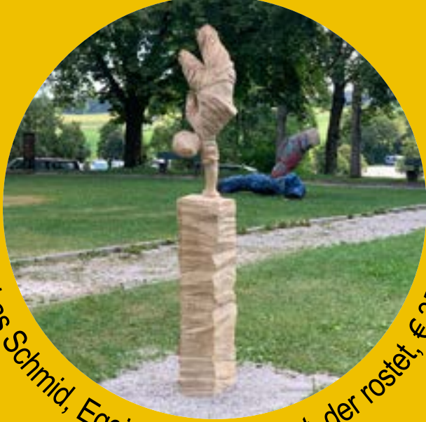
Lukas Schmid, Eggingen, wer rastet, der rostet, € 3500