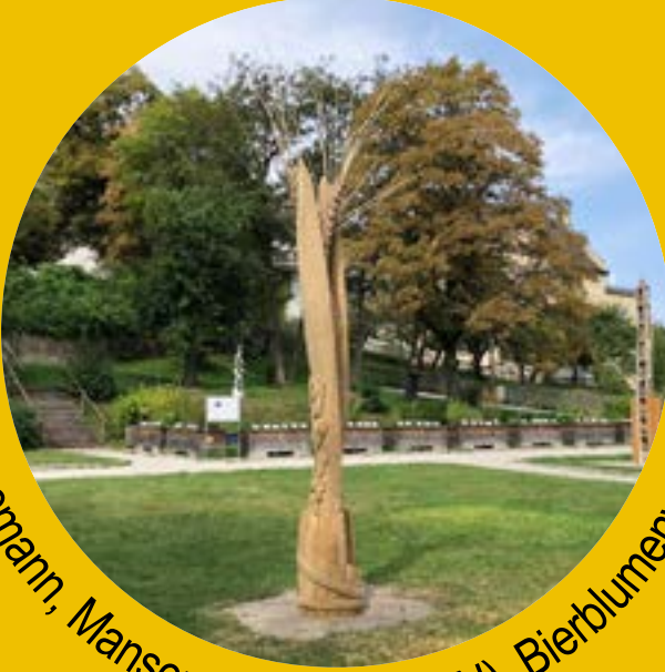
Volker Steigemann, Mansons Landing (CAN), Bierblumenwirbel, € 4500