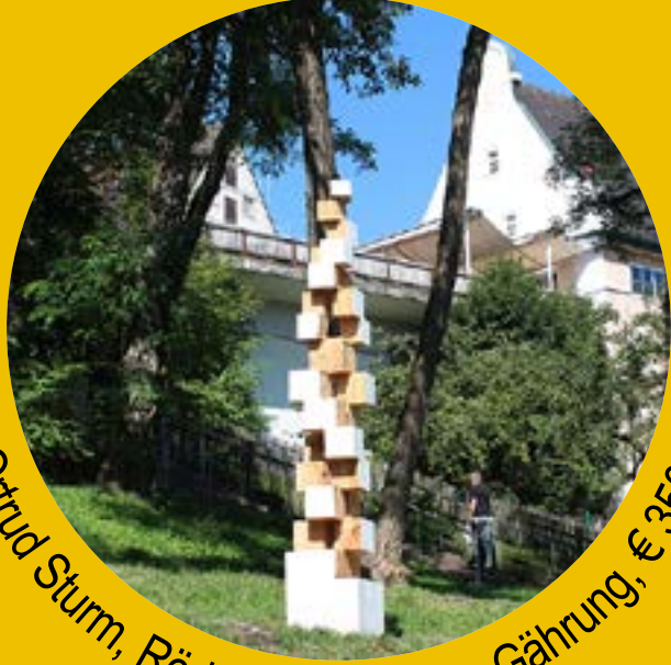
Ortrud Sturm, Rödermark, Alles in Gärung, € 3500